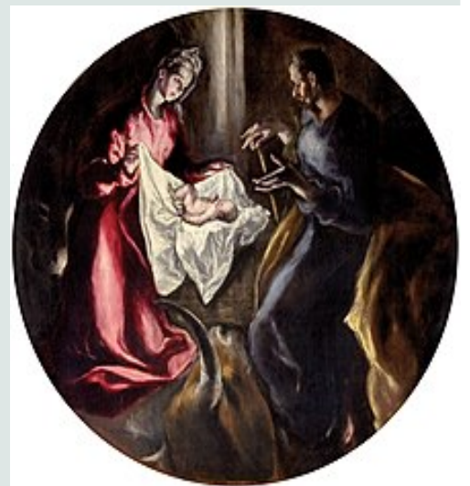
Η Γέννηση του Ιησού σε πίνακα του Δομήνικου Θεοτοκόπουλου