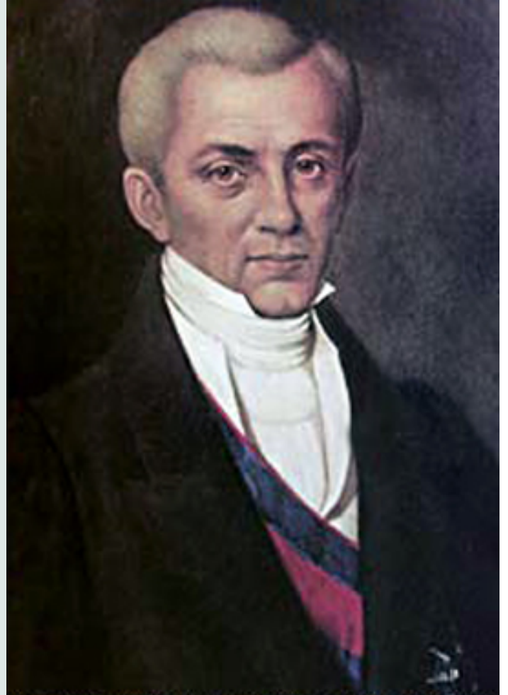
Ο Ιωάννης Καποδίστριας, Κωνσταντίνος Ηλιάδης, Συλλογή Πανεπιστημίου Αθηνών

Στις δύσκολες κοινωνικοοικονομικές συνθήκες του νεοσύστατου ελληνικού κράτους τα σχολεία θα βοηθούσαν το λαό να αναδειχθεί πνευματικά, ηθικά και βιοτικά.