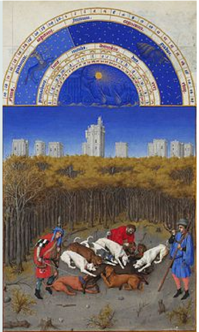
Το Καλαντάρι του Δεκεμβρίου από το Très riches heures du duc de Berry

Στον Πόντο παλιότερα ονομαζόταν Χριστιανάρης , στη Ρόδο Χριστουγεννάρης , στη Λέσβο Χριστουγεννιάτης και αλλού Χριστουγεννάς .